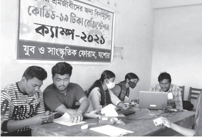
যশোরে যুব ফোরাম সদস্যরা দরিদ্র শ্রমজীবীদের জন্য বিনামূল্যে করোনা প্রতিরোধী টিকা নিবন্ধন কার্যক্রম