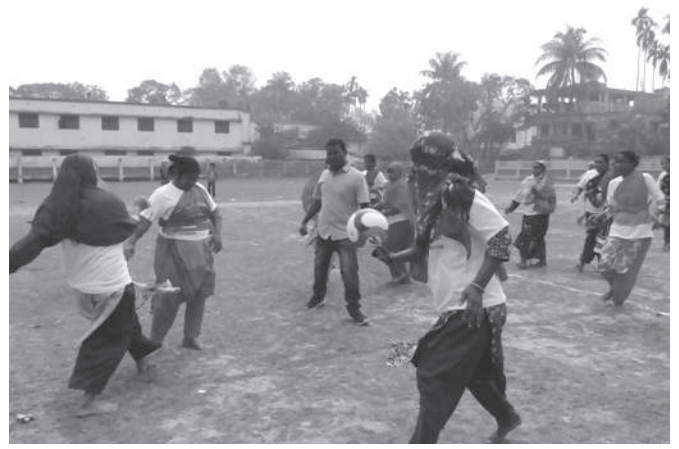
১৭ ফেব্রুয়ারি ২০২১ যশোরে বার্ষিক সামাজিক সমাবেশে ফুটবল প্রতিযোগিতায় অংশ নেন স্থানীয় নারীরা।