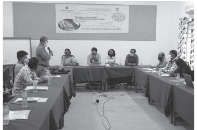
কুতথ্য প্রতিরোধে যশোরে স্থানীয় গণমাধ্যমকর্মীদের নিয়ে কর্মশালা করে ইনস্টিটিউট ফর এনভায়রনমেন্ট অ্যান্ড ডেভেলপমেন্ট (আইইডি)।