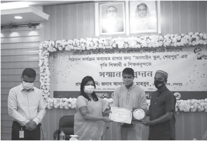
করোনাকালীন অনলাইন স্কুল পরিচালনার জন্য জনউদ্যোগকে বিশেষ সম্মাননা প্রদান করে শেরপুর জেলা প্রশাসন।