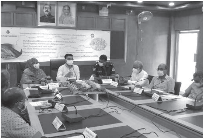
কুতথ্য প্রতিরোধে ময়মনসিংহের জনপ্রতিনিধি ও সুশীল সমাজ সদস্যদের নিয়ে কর্মশালা করে ইনস্টিটিউট ফর এনভায়রনমেন্ট অ্যান্ড ডেভেলপমেন্ট (আইইডি)।